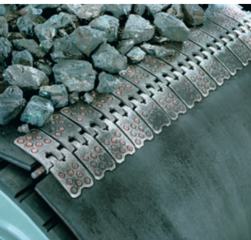
Flexco Europe GmbH

Механические соединители Rivet Hinged обеспечивают высокое сопротивление разрыву и равномерно распределяют нагрузку по ширине ленты